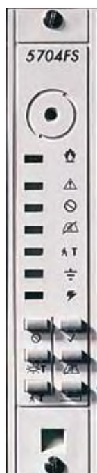
Пульт контроля пожарной сигнализации