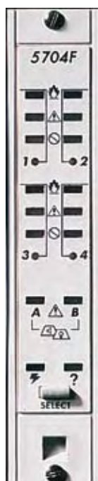
Четырехзонная плата системы пожарной сигнализации