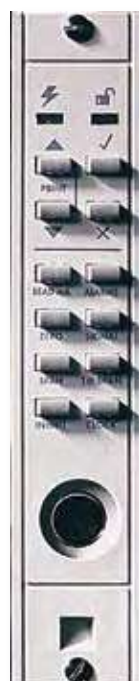
Плата технического обеспечения