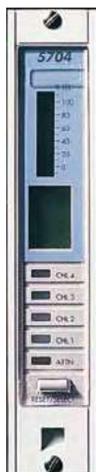
Четырехканальная плата управления системы обнаружения газов