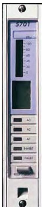
Одноканальная плата управления системы обнаружения газов