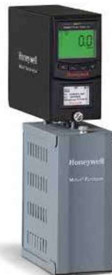
Детектор газа Midas с пиролизером Midas

* Газы, для которых требуется пиролизер Midas