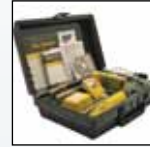
Насос отбора проб SamplerPak с двигателем привода