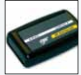
ИК канал передачи данных

Для получения полного списка принадлежностей обращайтесь в BW Technologies.