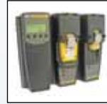
Совместимость с MicroDock II